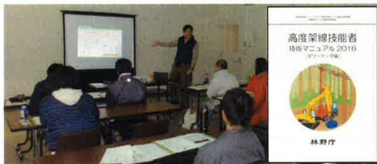
技術マニュアル(タワーヤーダ版)を用いた講義

現在稼働しているタワーヤーダを使用した、現地実習・演習が主体のカリキュラム 研修の受講料は無料ですが、旅費等の参加費用は自己負担となります