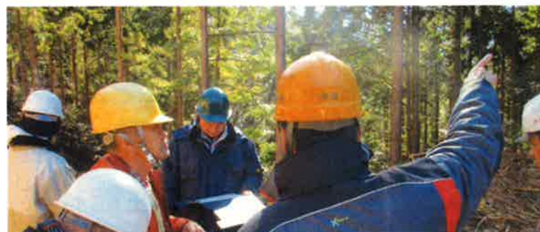
受講生が考える架線計画演習

タワーヤーダによる架線作業の手順や留意点のほか、高性能搬器や器具(ラウンドスリング等)の性能等に関する知識を習得