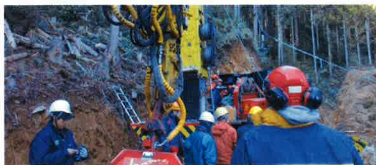
熟練技能者による現地実習